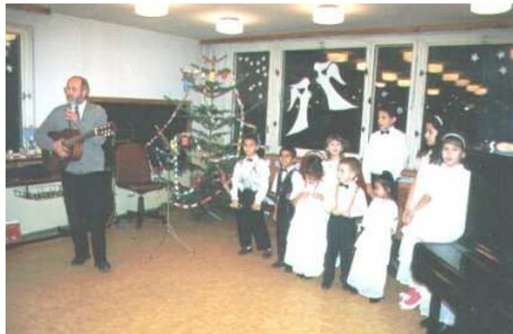
V azylovém domě se konají pravidelné biblické hodiny pro děti a hovory o víře pro dospělé. Evangelický sbor pořádá příležitostně společné akce s obyvateli azylového domu

Jádrem objektu je sál pro shromažďování sboru a konání bohoslužeb. K sálu přiléhají dvě křídla stavby, a to od jhozápadu byt duchovního a ze severovýchodní strany soubor dalších prostorů, určených pro každodenní život sboru.