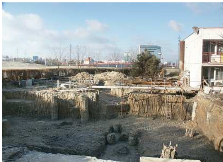
Staveniště sborového domu 11. ledna 2003

Život na tomto sídlišti s sebou nese řadu negativních sociálně patologických jevů. Děti a mladiství nemají dostatek příležitosti ke kvalitnímu programu ve volném čase a často se tak ocitají v různých partách, které v mnoha případech vedou až ke kriminální činnosti. Staří lidé, zvláště ti, kteří sem byli přestěhováni ze svého původního bydliště