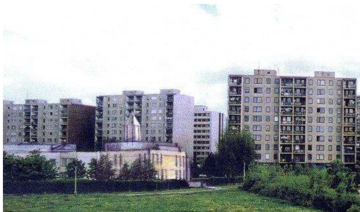
Pohled na sídliště se zakresleným sborovým domem

Na realizaci programů bude navrhovatel spolupracovat s Občanským sdružením Společnou cestou, Skautským střediskem č. 38 a Kulturním zařízením Chodovská tvrz.