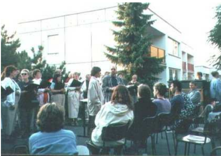
Shromáždění na místě budoucího sborového domu v sousedství stávajícího azylového domu

V přízemí jsou situovány hlavní sborové místnosti: vstupní hala s recepcí, hlavní sál, klubovna, oddělená od sálu mobilní stěnou, šatna, sanitární vybavení, kuchyň. Hlavní sál je tvořen prostorem tvaru kruhové výseče. Ve středu kruhu stojí stůl, odkud je vysluhována Svatá večeře Páně a odkud také vycházejí všechny další bohoslužebné aktivity sboru spolu s kázáním. Kolem tohoto středu jsou seskupeny řady sedadel účastníků bohoslužeb. Pro svátost křtu je vyhrazen prostor na obvodu kruhu. V těsné blízkosti kruhu jsou také situovány varhany. Součástí prostoru sálu je kruchta. Kapacita sálu je celkem 170 míst, při stolové úpravě 120 míst.