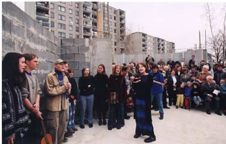
Pokládání základního kamene

V polovině roku 1998 sbor ČCE v Praze na Spořilově navázal živou spoluprací s azylovým domem v Donovalské ulici. Toto azylové centrum bylo založeno občanským sdružením "Společnou