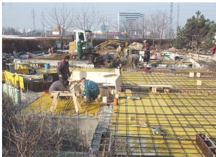
Staveniště sborového domu 22. února 2003